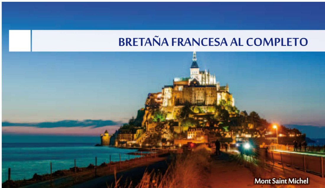
Mont Saint Michel