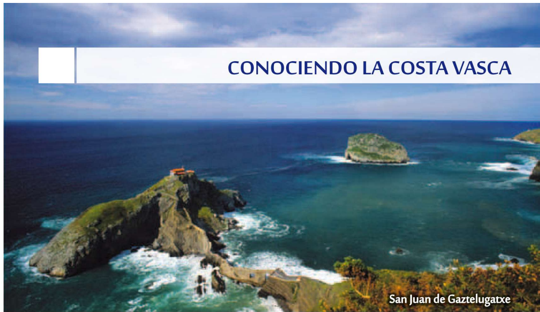
San Juan de Gaztelugatxe